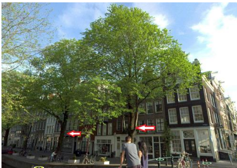
Foto van de 2 bomen